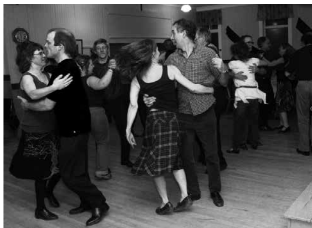
Swing; Christine Bricault 2014, ©Ministère de la Culture et des Communications

Durant l'exercice 2014-2015, le Conseil a analysé six dossiers, dont deux demandes pour des mises à jour de recueil ou guide de gestion de documents et quatre demandes de dépôt de documents inactifs.