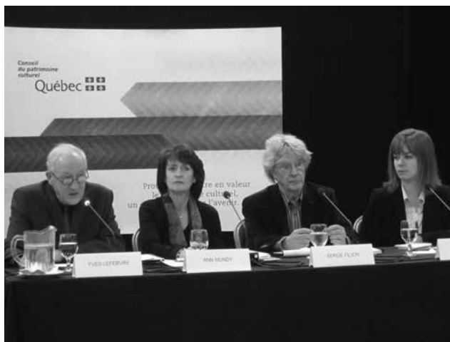
Consultation publique sur le plan de conservation du site patrimonial de Beauport

Le 2 février 2015, les deux rapports de consultation et les avis du Conseil étaient remis à la ministre.