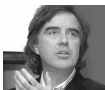
Pierre Thibault Architecte L'Atelier Pierre Thibault inc.