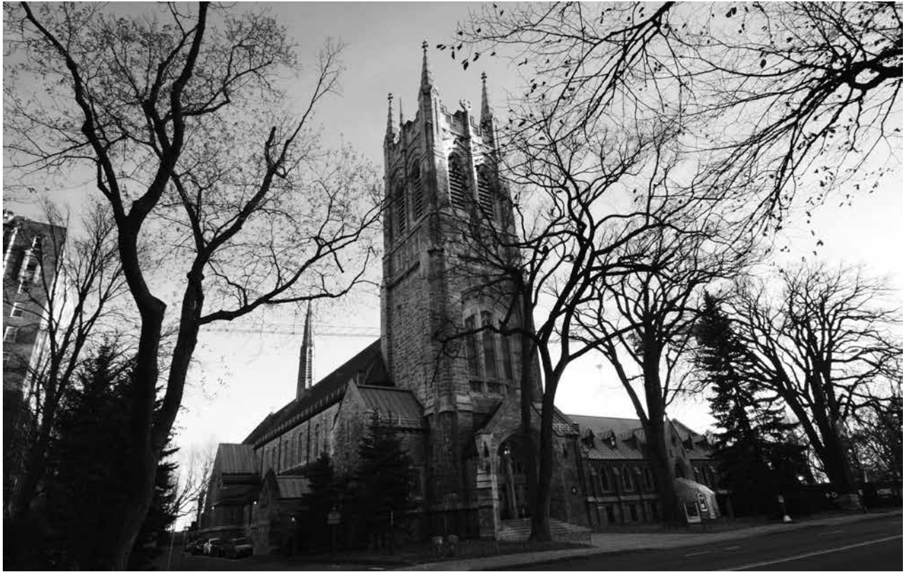
Église Saint-Dominique, Québec