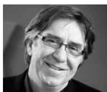
Claude Provencher Architecte Provencher Roy + associés architectes