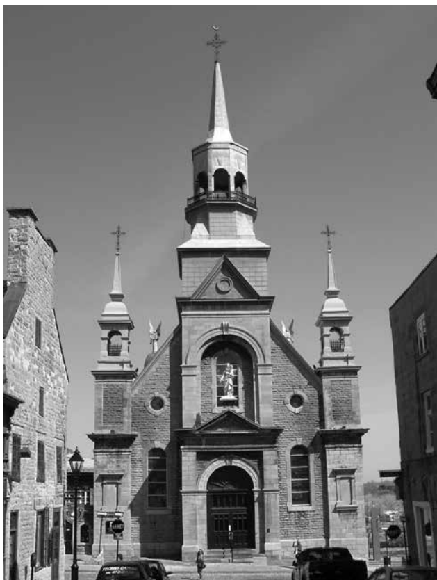
Chapelle Notre-Dame-de-Bon-Secours, Montréal

En vertu de la Loi sur le patrimoine culturel, le Conseil est aussi appelé à formuler un avis dans les cas de désignation. Les personnages, les lieux et les événements marquants de l'histoire du Québec ainsi que certains éléments du patrimoine immatériel peuvent être inscrits au Registre du patrimoine culturel. La désignation vise à favoriser la connaissance, la mise en valeur et la transmission de ces éléments du patrimoine culturel.