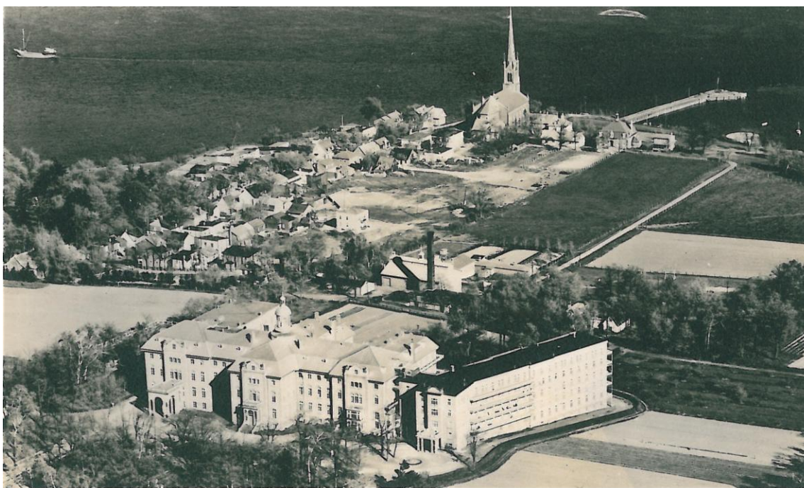
Collège Jésus-Marie de Sillery. Québec. Couvent. Pension des Dames.

Carte postale monochrome, n. d. : Collège Jésus-Marie de Sillery, Québec, Couvent Pension des Dames.